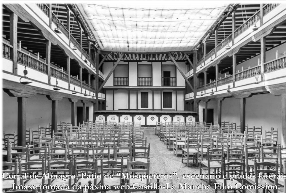
Corral de Almagro. Patio de “Mosqueteros”, escenario e gradas laterais.