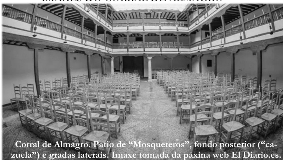
Corral de Almagro. Patio de “Mosqueteros”, fondo posterior (“cazuela”) e gradas laterais.